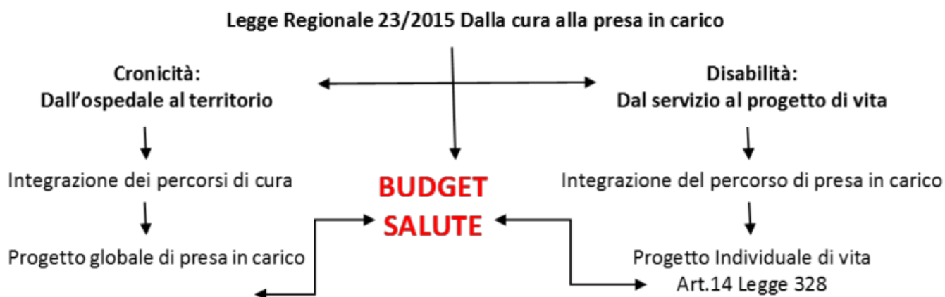
Figura 1 – Budget di salute a sostegno del progetto individuale di vita

Dal modello di cura al modello di preso in carico: il Progetto L-inc si pone pro-attivamente rispetto ai contenuti della riforma regionale lombarda (Legge regionale 23/2015) provando a sperimentare nuovi strumenti e nuove prassi di lavoro per attuare concretamente, nell'area della disabilità, il passaggio dal modello di cura al modello della presa in carico (Fig. 1).